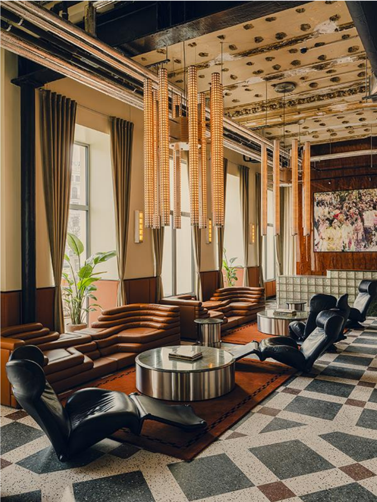
Hotel in Wien von weStudio