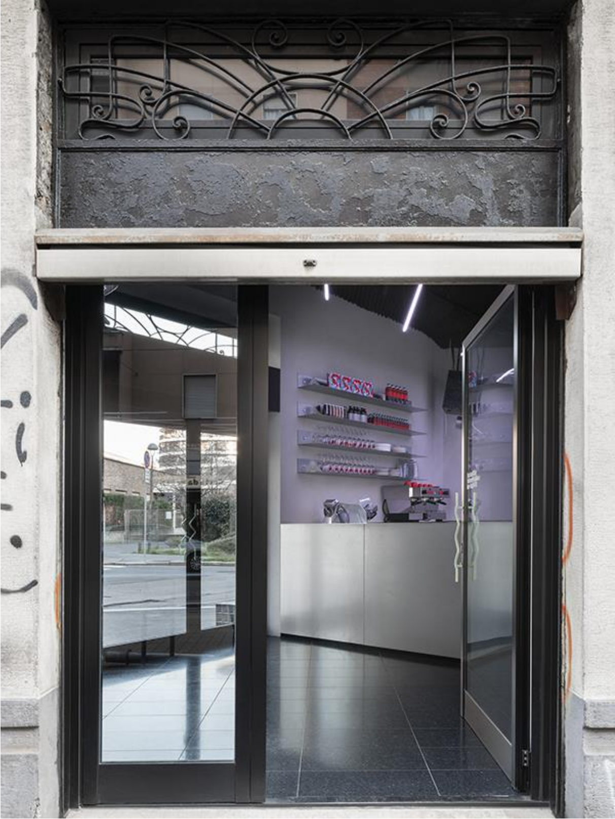
Bar in Mailand von studio wok