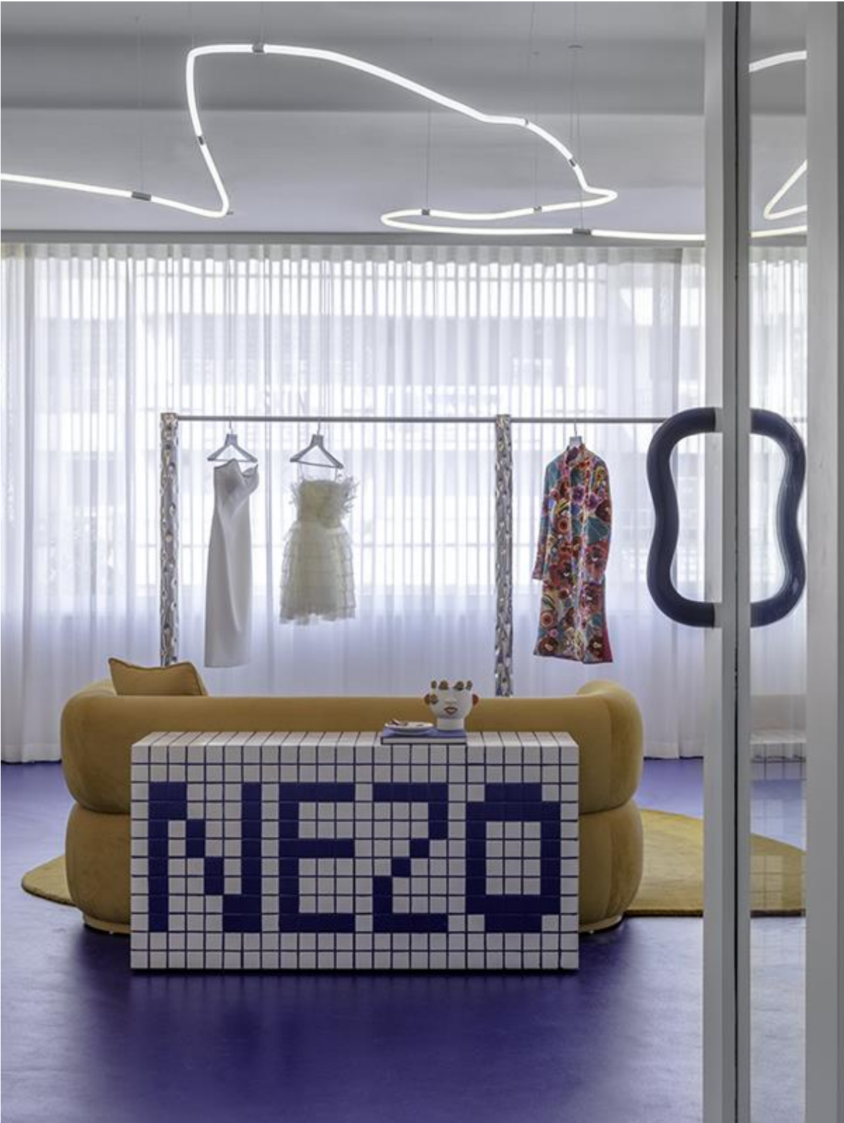
Showroom in Mumbai von Sanjay Puri Architects