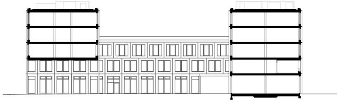
Square 1, Berlin Cross section B2