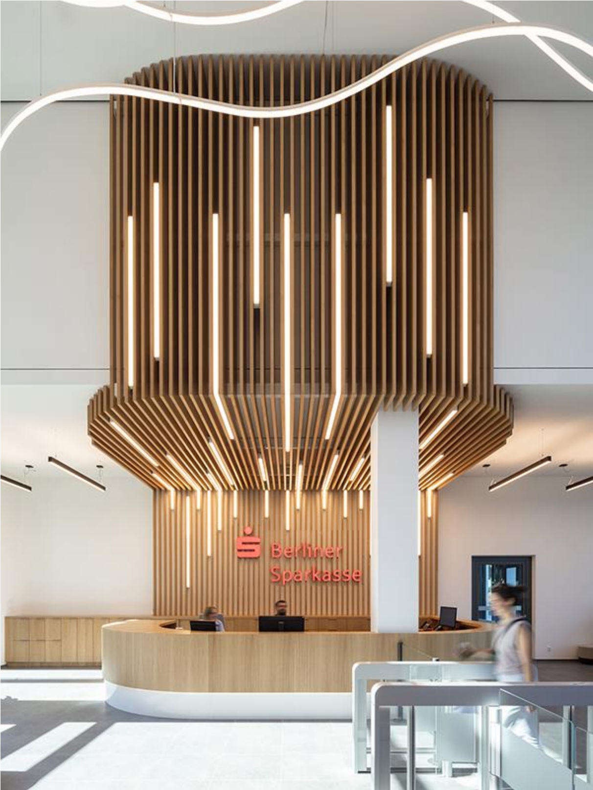
Bürogebäude in Berlin von Tchoban Voss Architekten