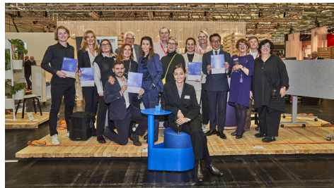
Preisträger*innen Innovationspreis Architektur+ Office 2022