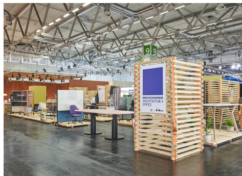
Stand Innovationspreis Architektur+ Office