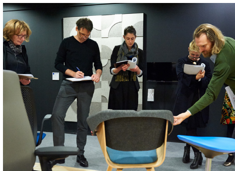
Jurysitzung Innovationspreis Architektur+ Office