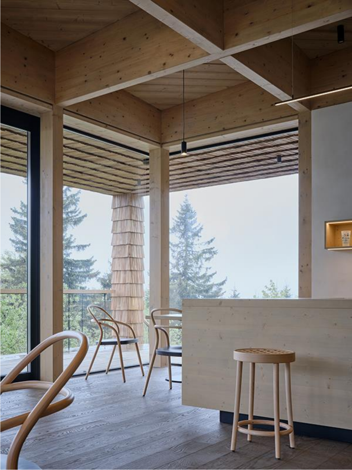
Touristenzentrum in Mittel Betschwa von henkai architekti