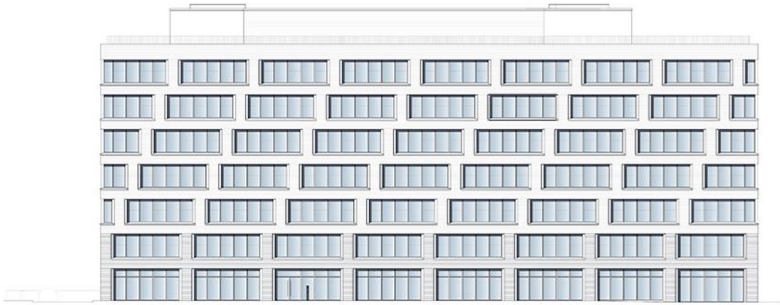
0 10 Frankfurter Allee 206, Berlin East elevation 1:200