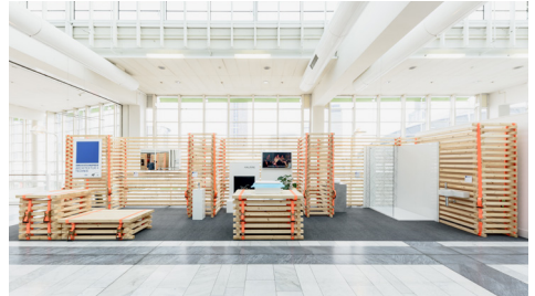
Standbausystem der Innovationspreise

Die Innovationspreise richten sich an Unternehmen und verarbeitende Betriebe sowie an Innen-/Architekt*innen, die in diesen Bereichen tätig sind. Sie zeichnen unter architektonischen Kriterien Produkte und konzeptionelle Lösungen aus, die sowohl durch Gestaltung als auch Funktionalität überzeugen.