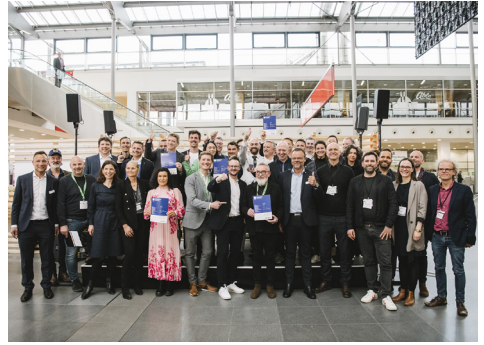
Preisträger*innen und Jury 2023