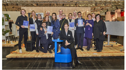
Preisträger*innen Innovationspreis Architektur+ Office 2022