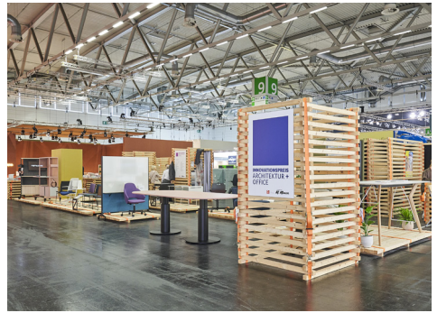
Stand Innovationspreis Architektur+ Office