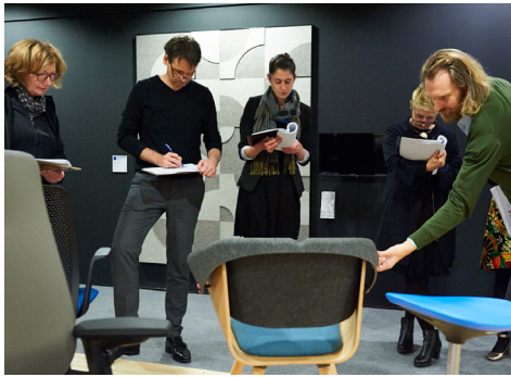
Jurysitzung Innovationspreis Architektur+ Office