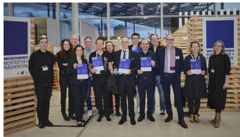
Preisträger*innen und Jury des Innovationspreis

Alle Innovationspreise werden im Rahmen öffentlicher Veranstaltungen während der jeweiligen Messe verliehen.