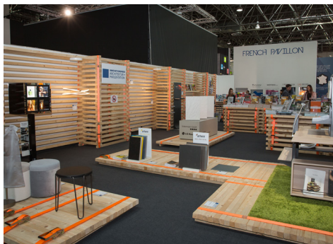
Stand Innovationspreis Architektur+ Präsentation