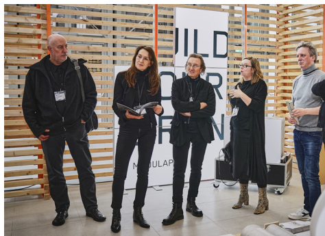
Jurysitzung Innovationspreis Architektur+ Präsentation 2020