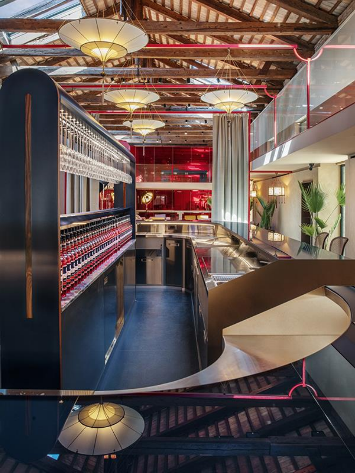
Bar in Venedig von Studio Marcante-Testa