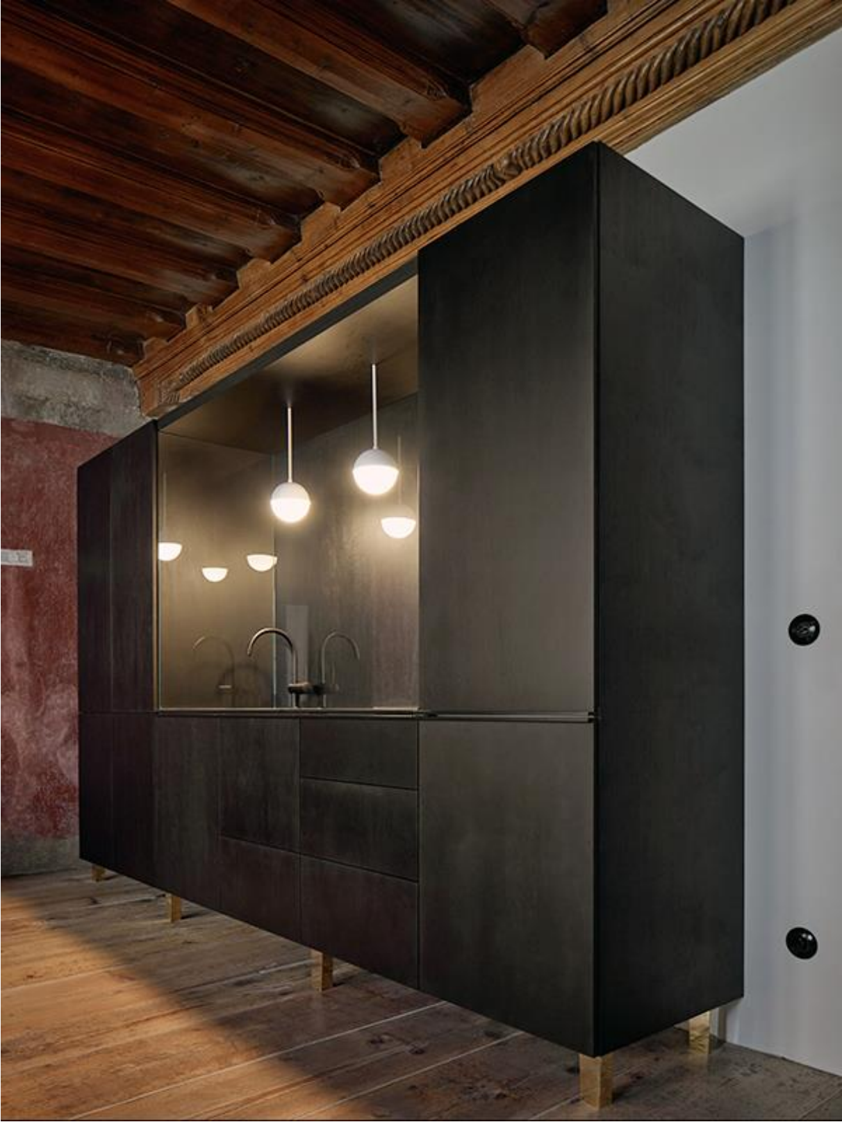
Apartment in Krumau von ORA