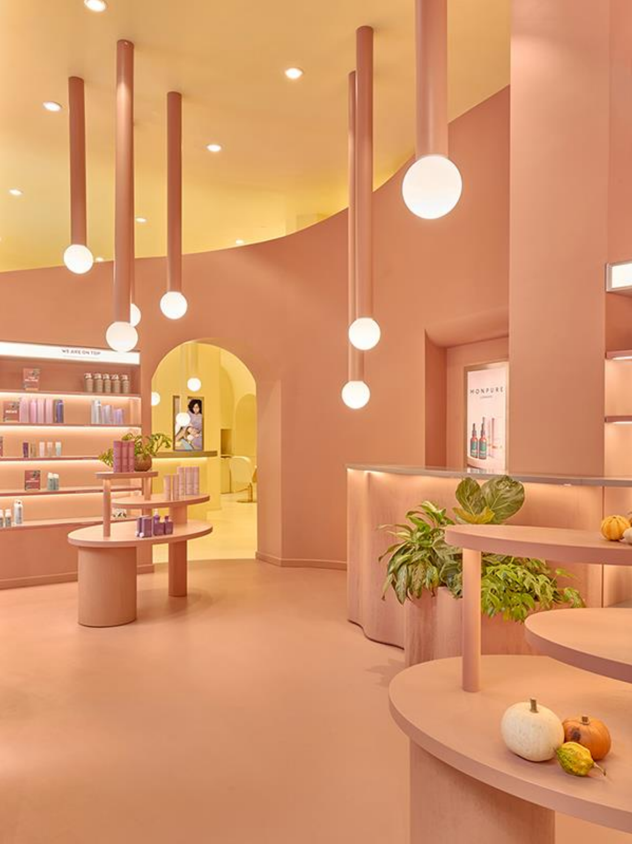
We Are Emma in Mailand von Masquespacio