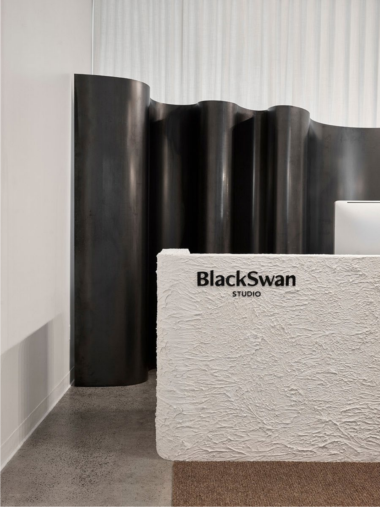
Tattoo-Studio in Montreal von Espace 313