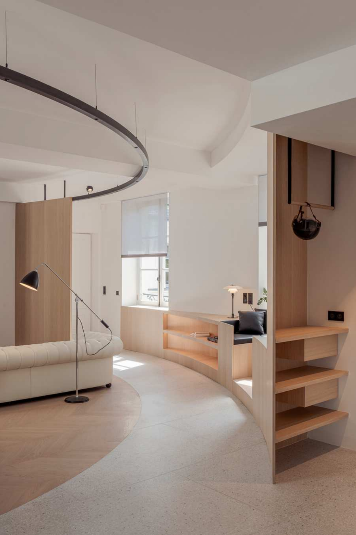
Apartment in Paris von noa* network of architecture