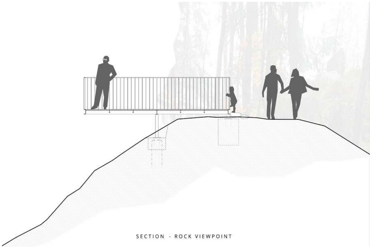
SECTION - ROCK VIEWPOINT