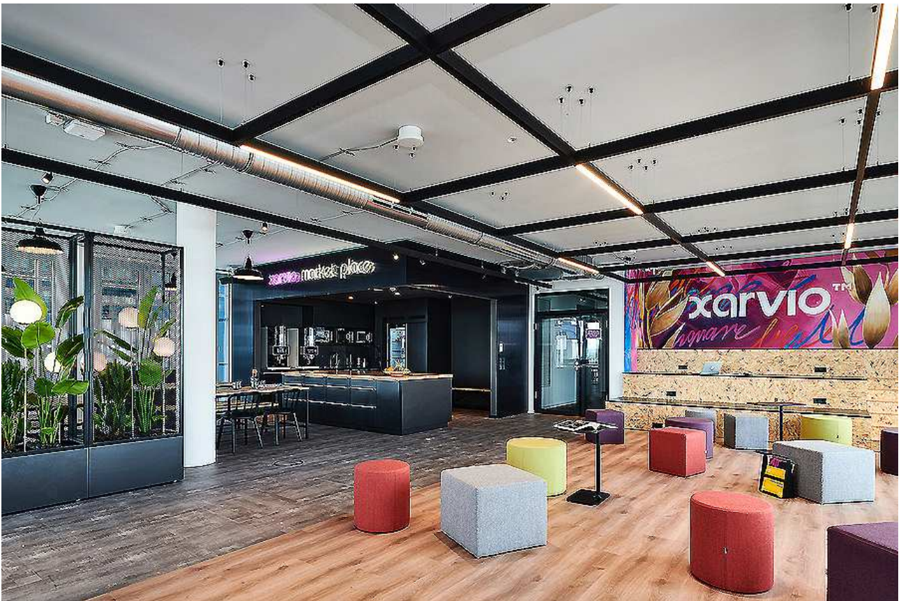
Entwurf: brandherm + krumrey, www.b-k-i.de Bauherr: BASF GmbH Standort: Im Zollhafen 24, Köln Fertigstellung: 2019