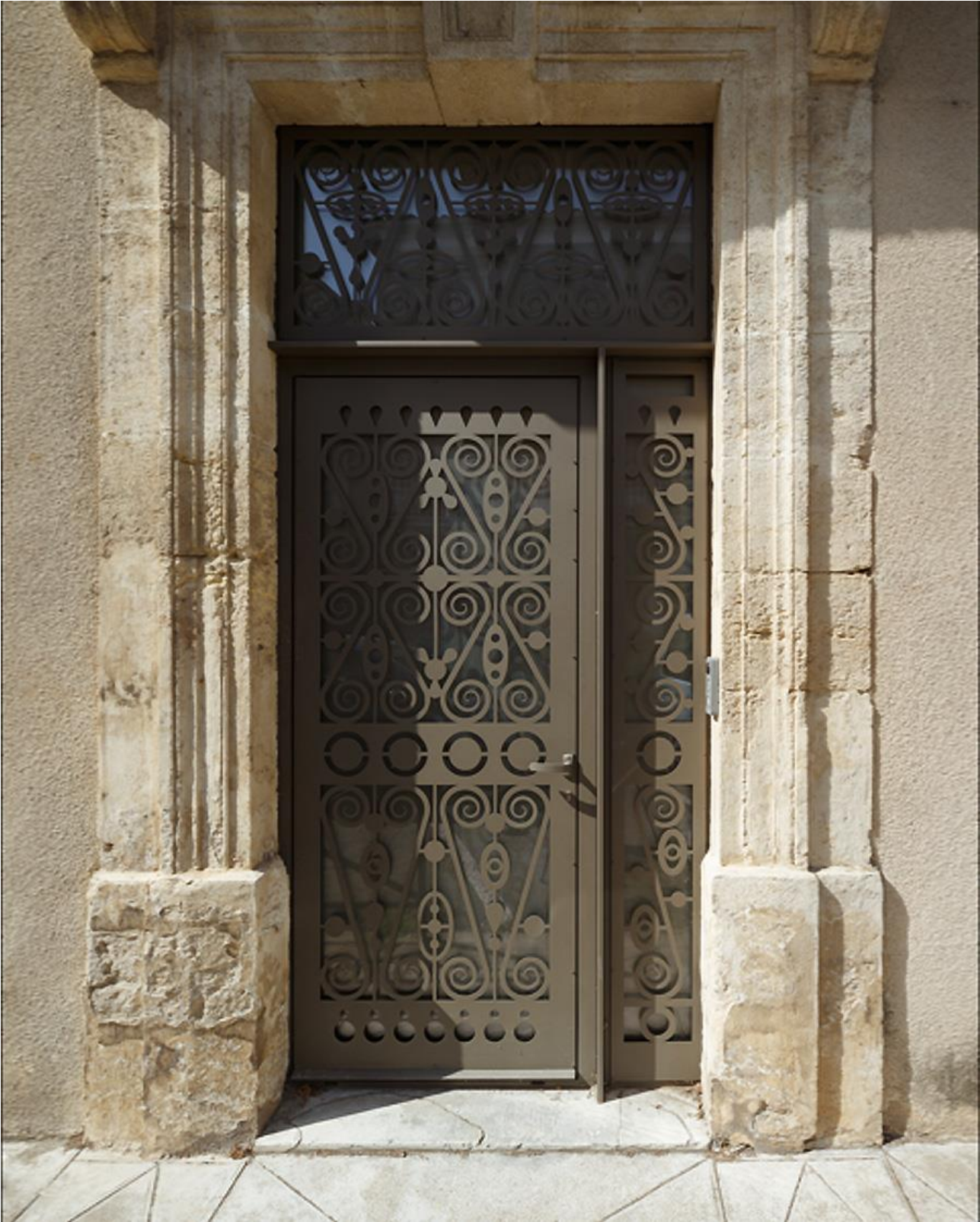
Wohnhaus in Castries von (ma!ca) architecture