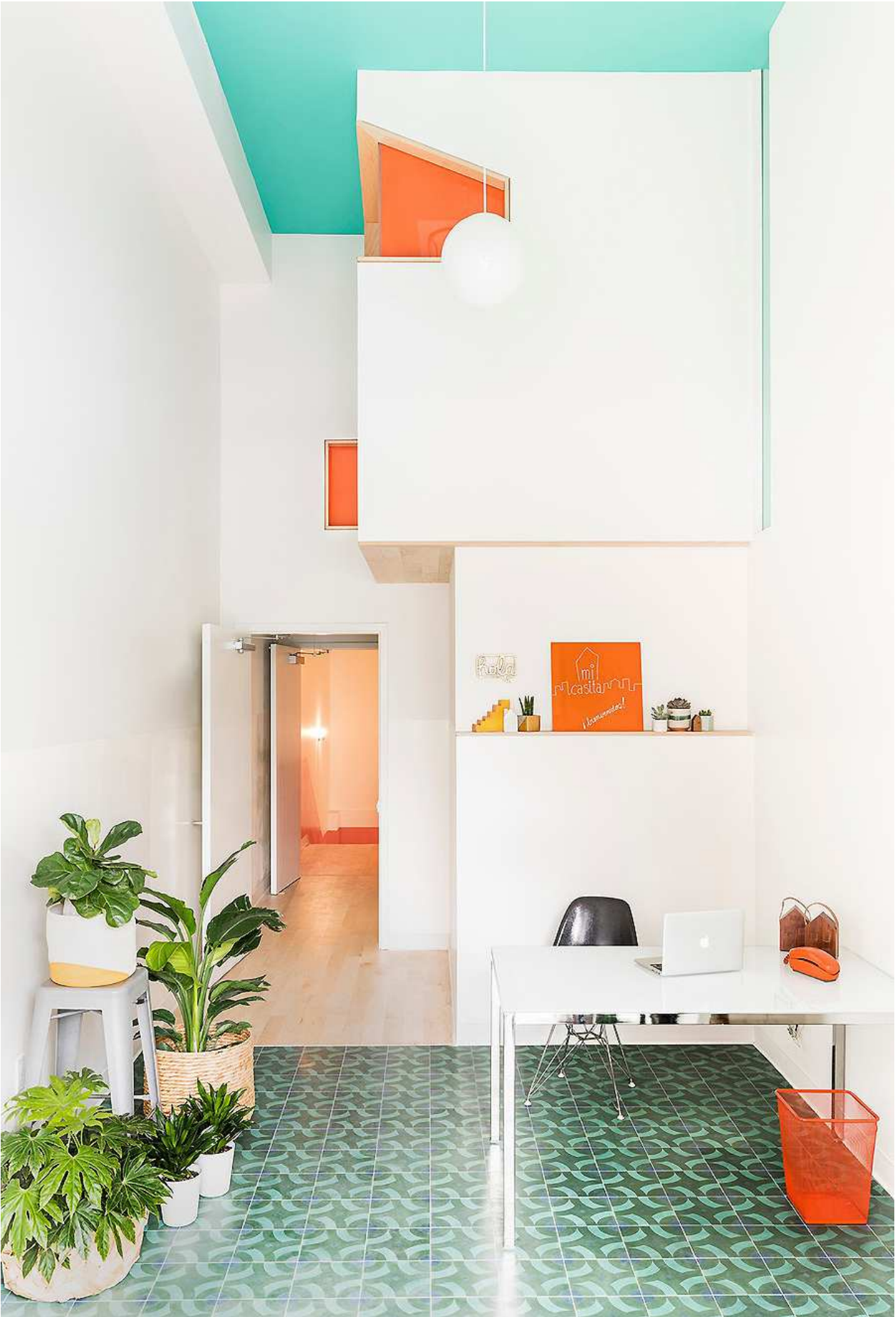
Vorschule mit Kulturzentrum in New York von Barker Associates Architecture Office