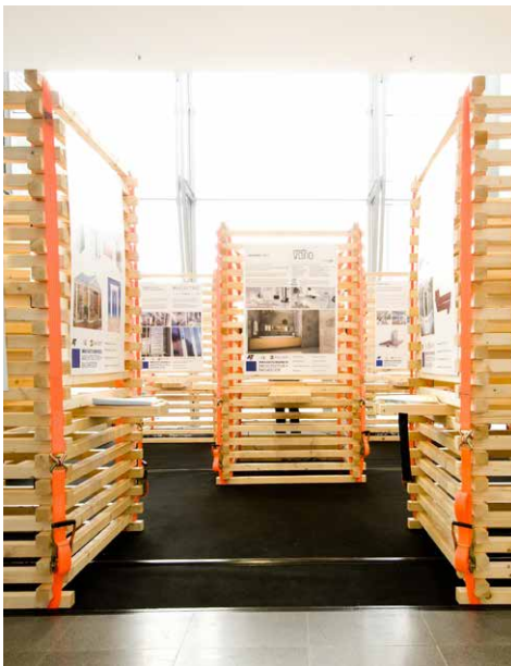
Sonderausstellung des Innovationspreis auf der BAU 2017