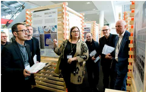
Juryrundgang am Messestand des AIT-Innovationspreises

Dann ist der Innovationspreis Architektur+ Bauwesen für Ihr Unternehmen hoch interessant: Industrieunternehmen und Entwerfer stellen sich mit ihren Produkten dem kritischen Urteil der Architekten. Anlässlich der BAU 2019 - der Weltleitmesse für Architektur, Materialien, Systeme - findet im kommenden Jahr bereits der 14. Innovationspreis Architektur+ Bauwesen statt. Er soll die Bedeutung architektonischer Qualität im Bauwesen unterstreichen, denn genau diese Qualität bildet die sichere Grundlage für ein erfolversprechendes Ergebnis. Unter den zahlreichen am Markt angebotenen Produkten werden diejenigen prämiert, die in besonderem Maße den Belangen der Architekten entsprechen.