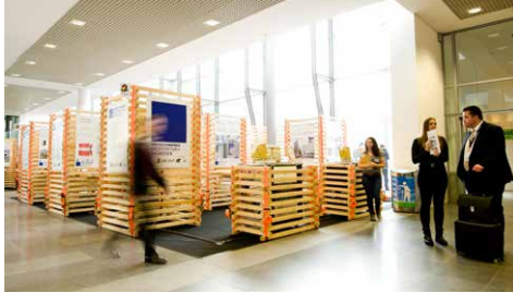
Sonderausstellung des Innovationspreises auf der BAU 2017

Die Innovationspreise richten sich an Unternehmen und verarbeitende Betriebe sowie an Innen-/ Architekten, die in diesen Bereichen tätig sind. Sie zeichnen unter architektonischen Kriterien Produkte und konzeptionelle Lösungen aus, die sowohl mit Gestaltung als auch Funktionalität überzeugen.