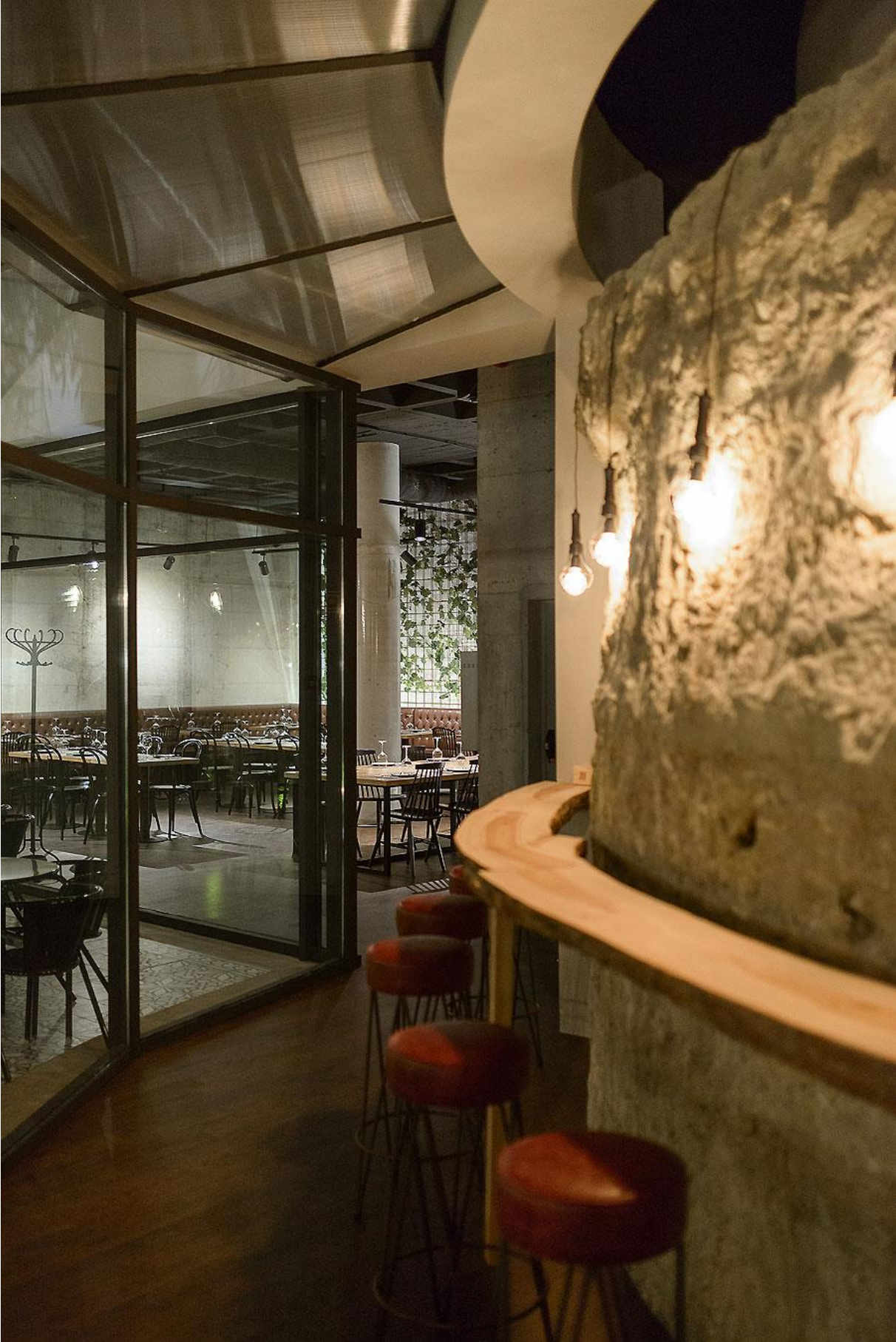
Restaurant Wine District in Lissabon von Arq Tailor's