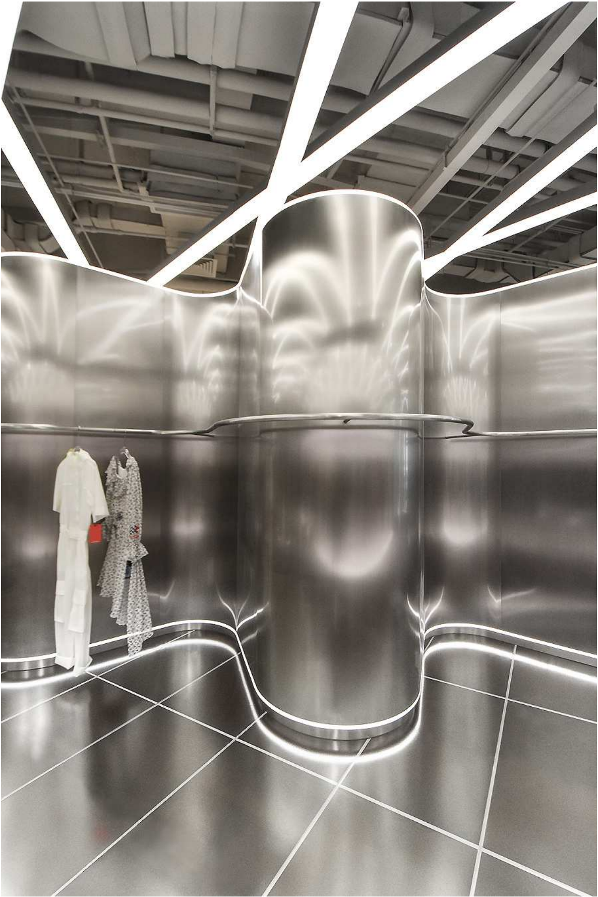
TGY Store in Shenyang von Ramoprimo