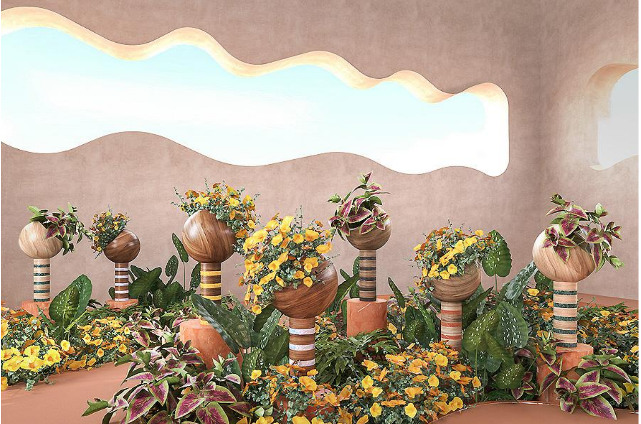
Entwurf: Masquespacio, www.masquespacio.com Fertigstellung: Mai 2020