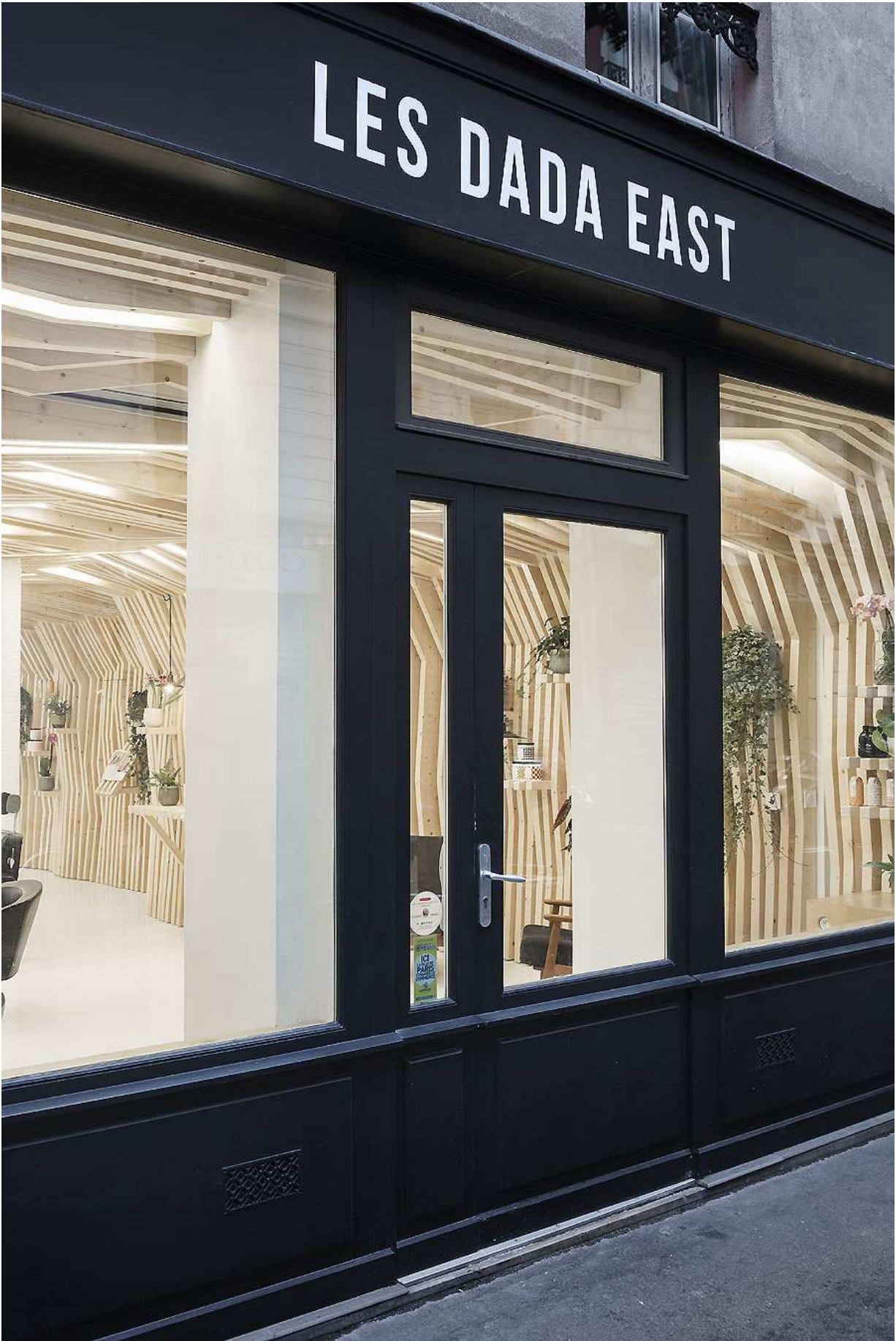
Friseur Les Dada East in Paris von Joshua Florquin Architecture