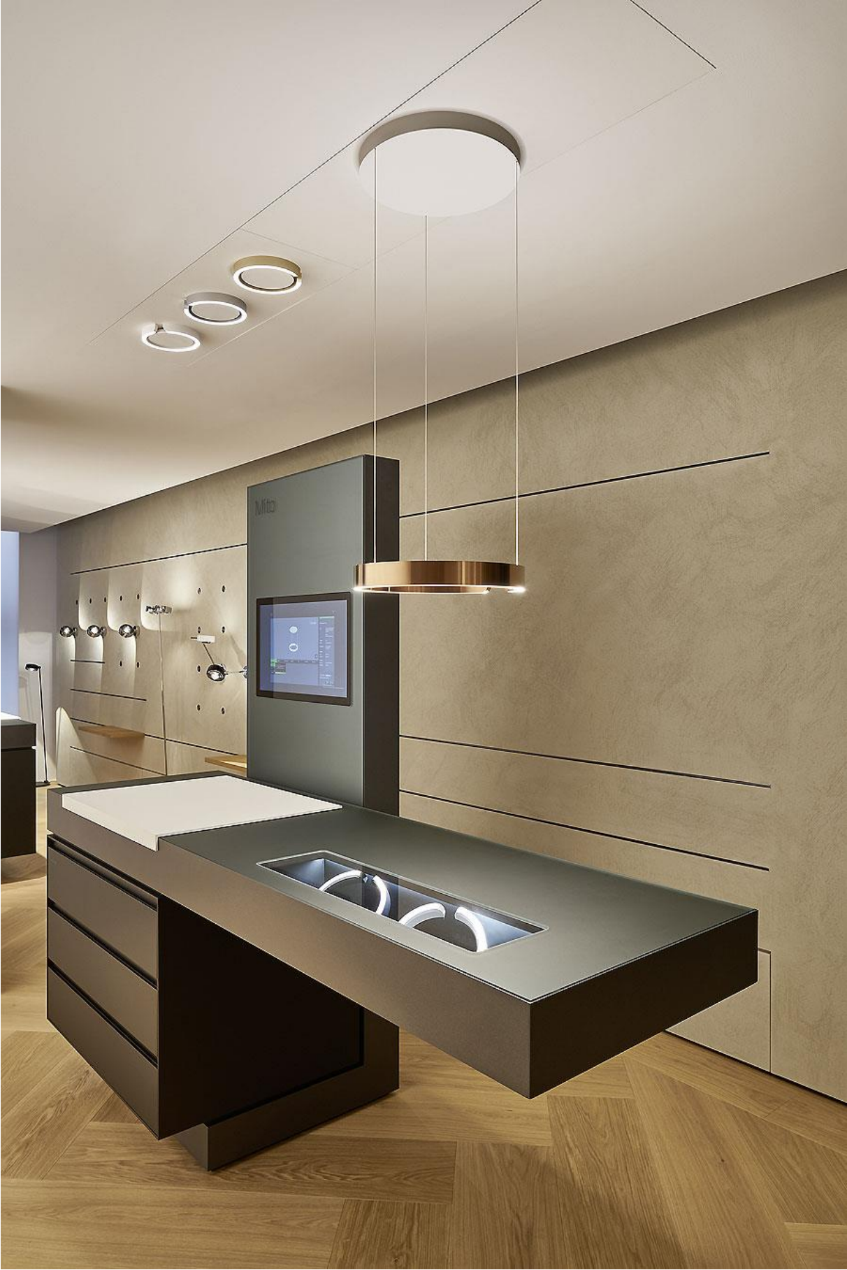
Occhio Flagship-Store in München von einszu33